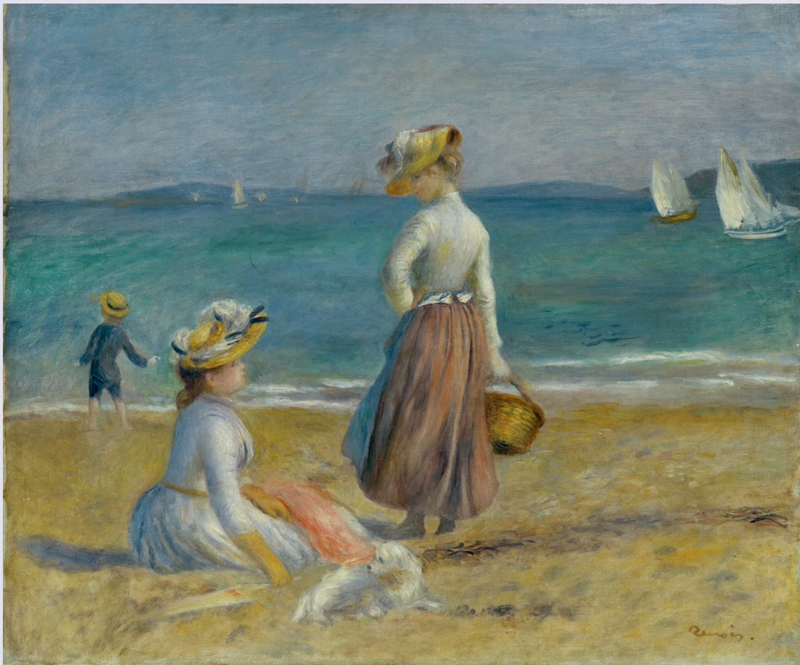
Auguste Renoir Figures On The Beach