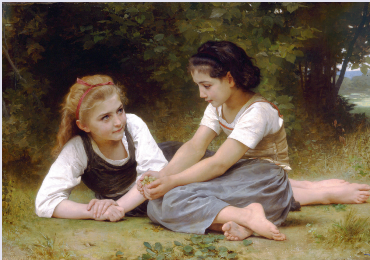
William-Adolphe Bouguereau The Nut Gatherers