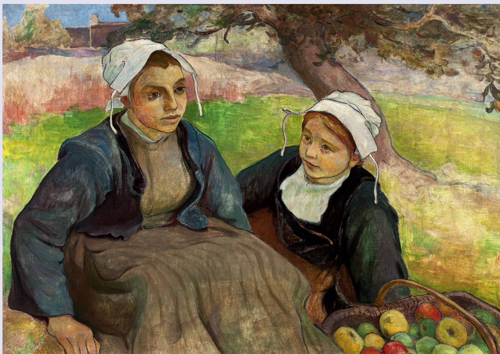
Władysław Ślewiński Dwie Bretonki z koszem jabłek