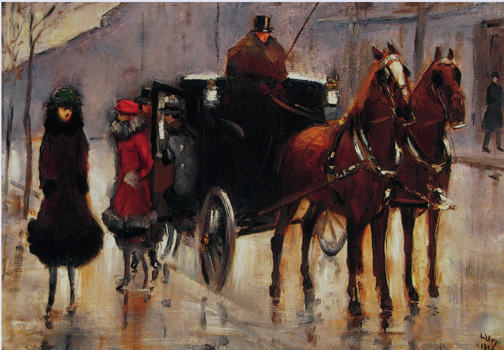
Ury Lesser Damen, einer Droschke entsteigend