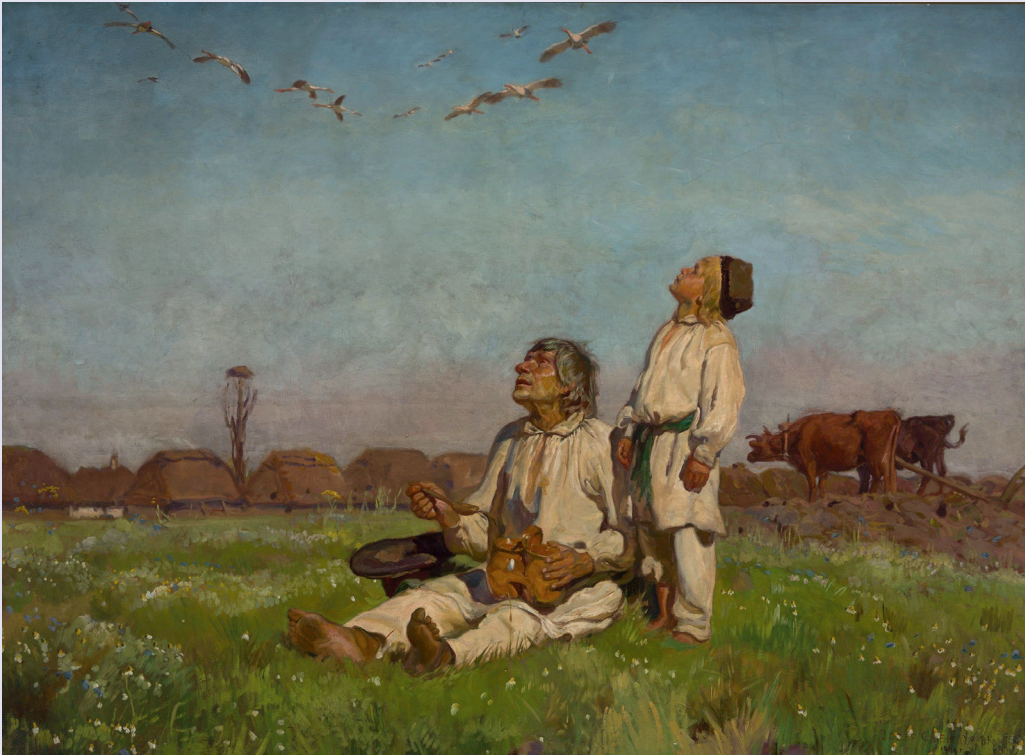
Józef Chełmoński Bociany