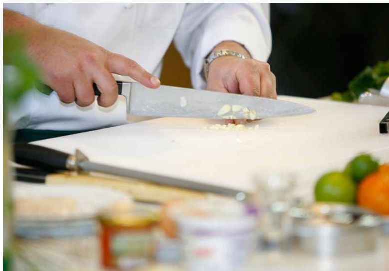
Międzynarodowe Targi Gastronomiczne EuroGastro 2008, fot. K. Kuczyk

słownictwa, ćwiczeń językowych i dialogów oraz nagrania związane z dwoma działami: Kuchnia i Restauracja . Wkrótce będą dostępne materiały dotyczące Recepcji i Zakwaterowania .