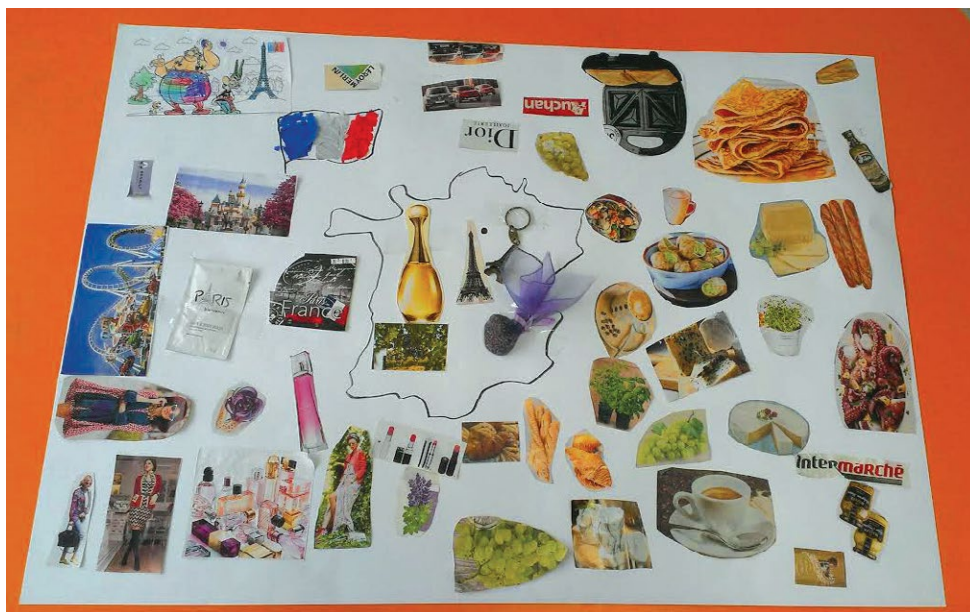
PLAKAT wykonany z grupą przedszkolną 5-latków podczas zajęć według niniejszego scenariusza.