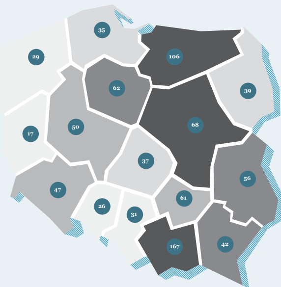
LICZBA NAUCZYCIELI – bezpośrednich odbiorców ET w latach 2002-2016

Na podstawie Teaching English with English Teaching. 15 lat Programu w Polsce .