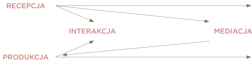
TABELA 1. Działania językowe – mediacja (źródło: Les Langues vivantes: apprendre, enseigner, évaluer. Un Cadre européen commun de référence , 1998:178)

SCHEMAT 1. Działania językowe w wersji ESOKJ z 1998 r. (źródło: Les Langues vivantes: apprendre, enseigner, évaluer. Un Cadre européen commun de référence , s. 16)