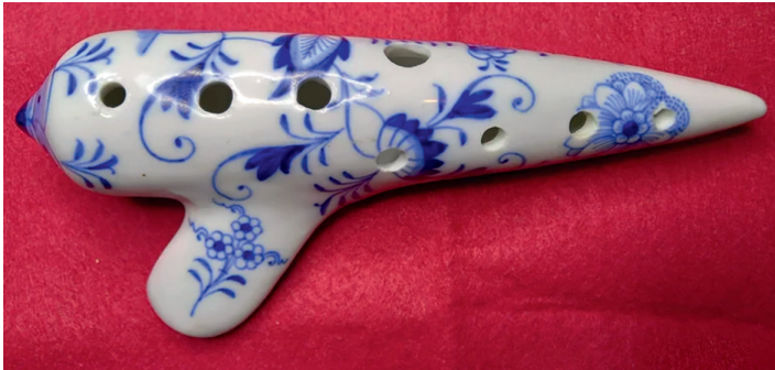
Fot. 3. Miśnieńska porcelanowa okaryna