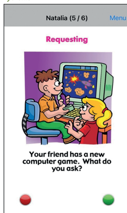
Rysunek 5. Karta Życzenia