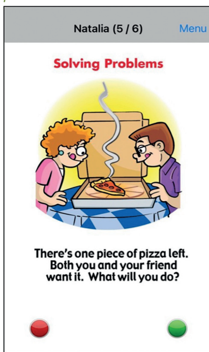
Rysunek 4. Karta Rozwiązywanie problemów