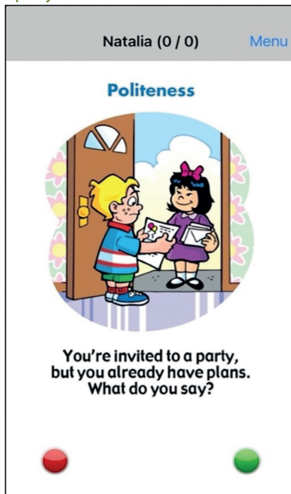
Rysunek 2. Karta Uprzejmość

Kompetencja pragmatyczna stanowi jeden z kluczowych elementów skutecznej komunikacji. W związku z tym powinna zajmować istotne miejsce w procesie nauczania języka angielskiego jako języka obcego. Analiza literatury przedmiotu oraz przegląd dostępnych